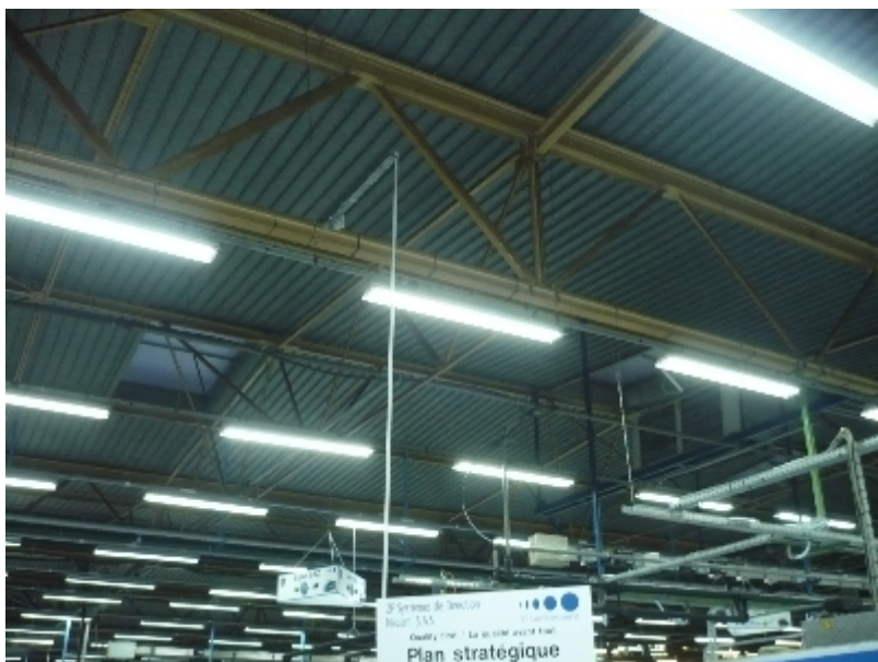
Halle de stockage/entrepôt